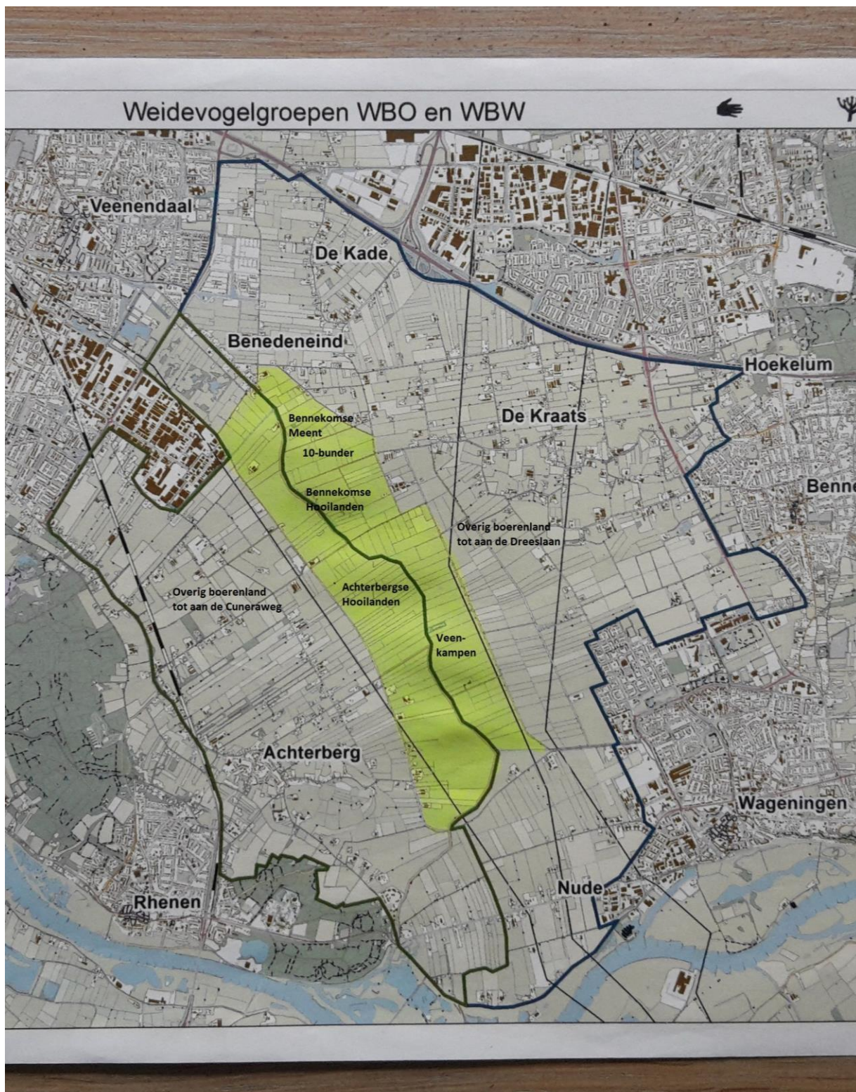
Kaart met gebiedsaanduidingen behorende bij de tabel op de vorige bladzijde